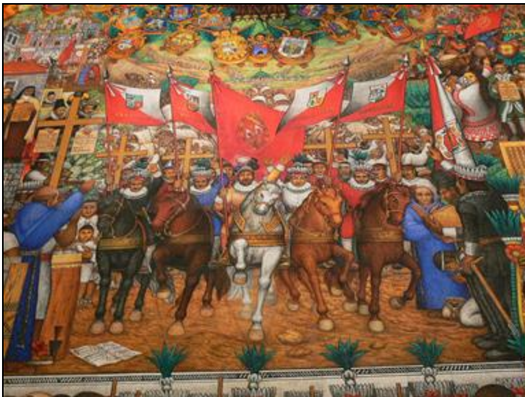
Η σημαία της Τλαξκάλα

Οι Ισπανοί τράπηκαν σε φυγή τη νύχτα της 30ής Ιουνίου 1520 φορτωμένοι με χρυσάφι και θησαυρούς. Πολλοί από αυτούς σκοτώθηκαν ή αιχμαλωτίστηκαν και θυσιάστηκαν στους θεούς. Αυτή η νύχτα ονομάζεται η «θλιμμένη νύχτα». Όσοι επέζησαν, συμπεριλαμβανομένου του Κορτές, κατέφυγαν στην Τλαξκάλα.